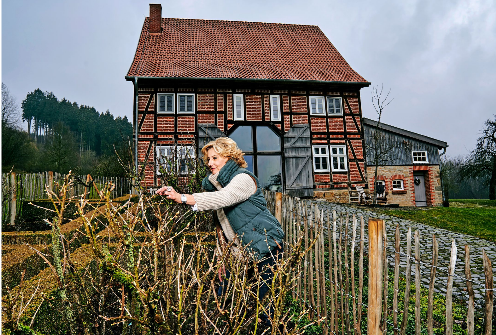
Rechts: Selbstversorgerin Der Gemüsegarten des Heinrichhofs verspricht grosse Ernte.

► einsetzt. Weshalb sie sich aus der Privatwirtschaft zurückgezogen hat, erklärt sie simpel: «Weil wir in der Schweiz so viel Glück haben, dass wir es weitergeben sollten.» Ihr aktuelles Grossprojekt «DearMamma» ist eine App zur Früherkennung von Brustkrebs: «Wir wollen damit erreichen, dass sich alle Frauen regelmässig selber untersuchen.»